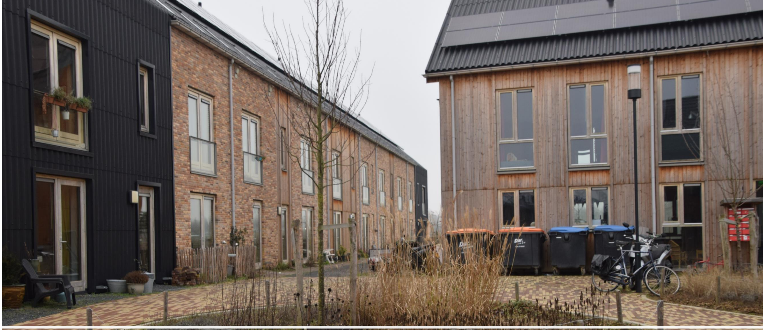
Ecodorp Zuiderveld, Lent