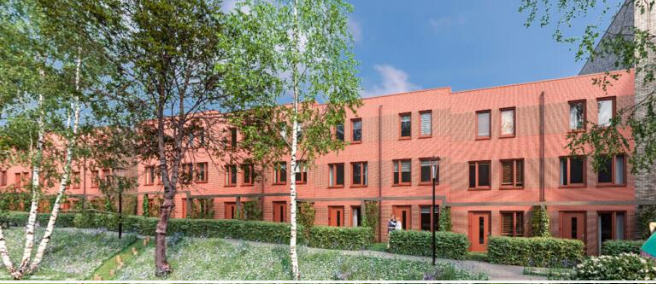
Hof van Leeuwesteyn, Utrecht