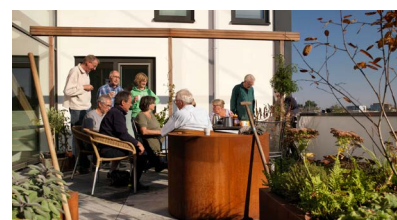
Marktmeesters, Utrecht (Kees Hummel)